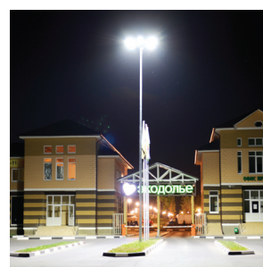
Въезд в коттеджный посёлок г. Обнинск 2014

Светодиоды нового поколения имеют одни из лучших на сегодняшний день показателей по соотношению лм/Вт, сроку службы и надёжности.