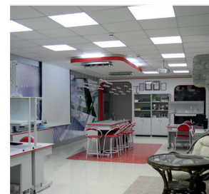
Лабораторный кабинет г. Казань

Требования письма Руководителя Роспотребнадзора Г.Г. Онищенко от 01.10.2012 № 01/11157-12-32 «Об организации санитарного надзора за использованием энергосберегающих источников света».